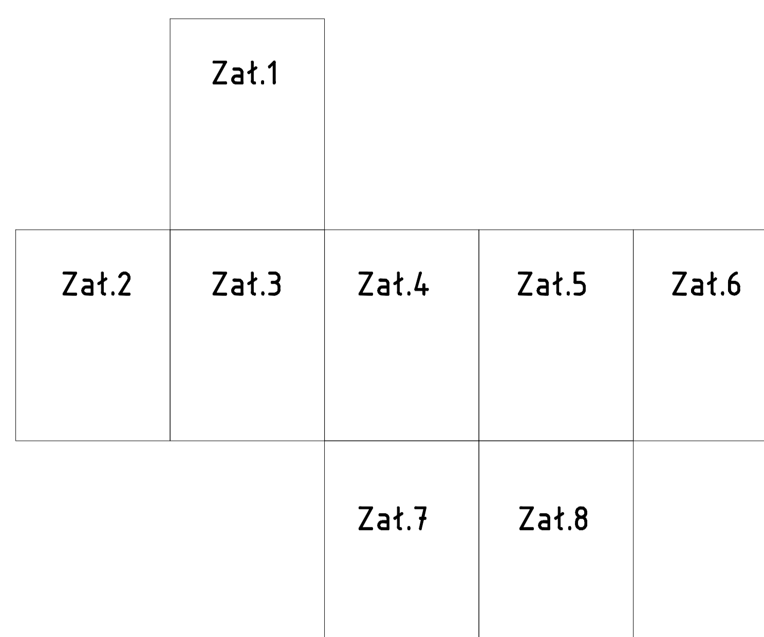
Schemat łączenia załączników: