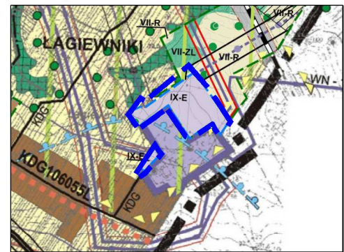
WYRYS ZE ZMIANY STUDIUM UWARUNKOWAŃ I KIERUNKÓW ZAGOSPODAROWANIA PRZESTRZENNEGO GMINY NIEMCE

Rysunek planu sporządzono na mapie ewidencyjnej w postaci elektronicznej